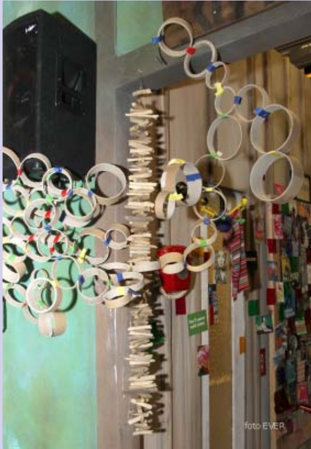
Decoratie uit de telenovelle De Elfenheuvel van karton en houtjes. Eenvoudig en decoratief.

Voor Ketnet staat de nieuwe telenovelle, "De Elfenheuvel" in de startblokken waarvoor de opnamen reeds werden gestart. Het verhaal vertelt over een elfje -Niels Destadsbader- die in de elfenwereld wordt gestraft en als straf wordt hij naar de aarde gestuurd waar hij terecht komt in een gastgezin. Uiteindelijk, moraal van het verhaal, verkiest het elfje om op aarde te blijven. De decors waarin het verhaal zich afspeelt zijn zogenaamde viermuren decors een, voor Vrt,