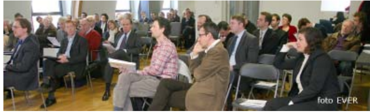
85 belangstellenden uit de professionele sector waren voor de voorstelling van het boek naar het Instituut afgezakt.