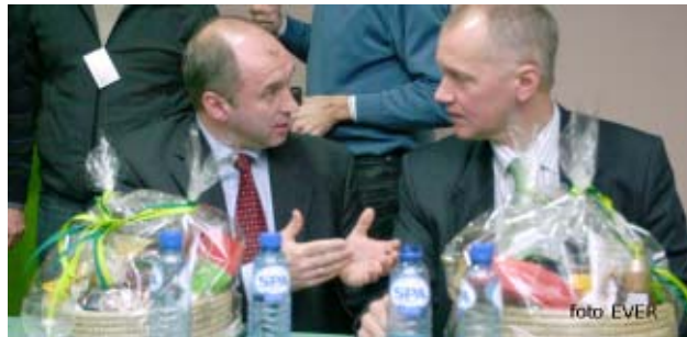
Verjans en Vermote, wolven in het bos bijten mekaar niet

de VDAB nog niet is opgedoekt, een reactie van de VDAB vindt u op blz 11. De VDAB zou meer gaan doen en dat met minder centen, maar we stellen vast dat voor bepaalde opleidingen, meer dan een jaar dient gewacht. Het ACV vraagt om de schaarse middelen in te zetten waar