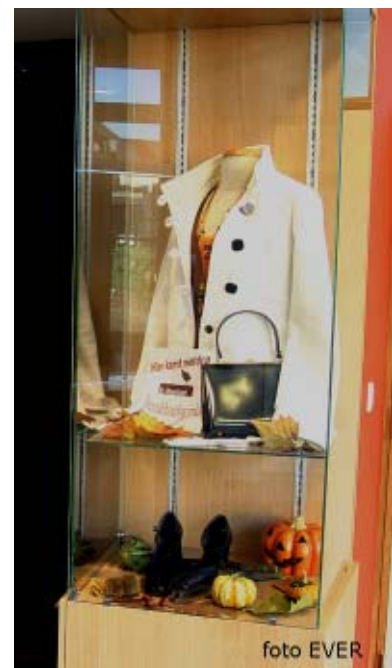
De vitrinekast van het OCMW Berlare, van voren "pront" en van achter "stro..."

Het OCMW van Berlare heeft in de Baron Tibbautstraat, 13 een vervallen huisje waarin een "winkel" voor tweedehandskledij is gevestigd, er is wat kledij ter beschikking, maar het stelt écht niets voor. Het is de bedoeling om de kledij in het nieuwe gebouw van het OCMW onder te brengen en bij de opening van Ter Meere heeft het OCMW van Berlare hare ware gelaat ter zake getoond. Terwijl vijftig meter verder in het "winkelkrot" niet eens fatsoenlijke kledij ter beschikking was, werd in de vitrine van het nieuw OCMW de indruk gewekt dat er kledij à la Avenue Louise ter beschikking wordt gesteld, een zeer misplaatste decadentie.