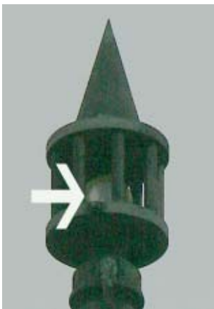
Foto van de verdwenen RADAC te Huldenberg. De pijl wijst de Beryllium container aan die niet doorprikt was door vogels.

André V. krijgt op 30 november 2004 van het FANC een bericht dat er op zijn gebouw een radioactieve bliksemafleider staat, het bewijs daarvan geeft het Agentschap echter niet. André stuurt al op 1 december om 11:33u een e-mail naar een