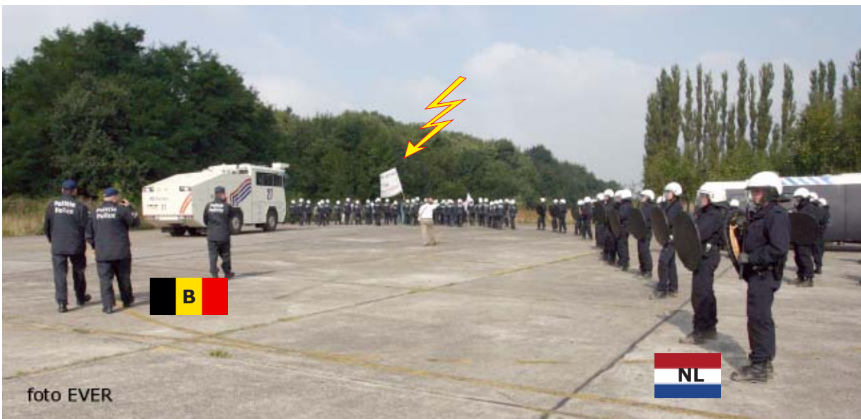
Internationale oefening te Brustem - oefening van een omsluiting van demonstranten.

Hier hadden drie manifestanten zich vastgemaakt aan een -vervallen-verkeerstoren van het vliegveld. Eén van hen hing in een klimharnas met de nodige beveiligingen halfweg de +/- 15meter hoge toren, maar zonder veel problemen liet een van de lock-on-team leden zich op dezelfde hoogte als de manifestant zakken, haakte de actievoerder vast aan zijn eigen beveiligde