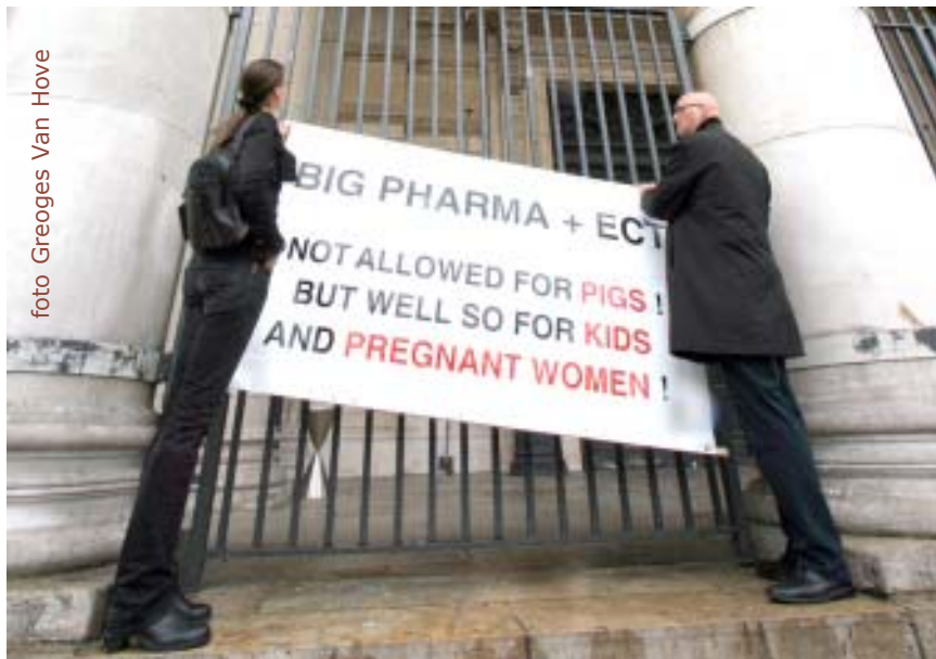
Zwarte mars van de Sarah beweging 7 sept 08 -MM 157- die vooral tegen het misbruik van de Pharmaceutische industrie was gericht.

De Strattera geheimen bevatten o.m. dat men de "ziekte" van het normale gedrag behandelt door "patiënten" te behandelen met psychotica om hen daarna, via de nevenwerkingen, aan de nog duurdere antipsychotica te brengen. Dit levert gigantische winsten op voor de farmaceutische industrie en