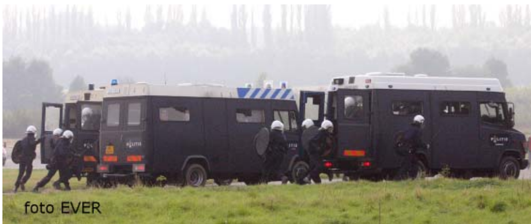
Actie en bijstand van de Nederlandse Mobiele Eenheid -ME-