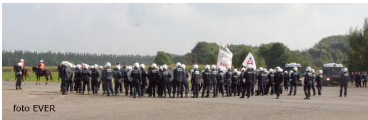
Betogers omsingeld door Belgische en Nederlandse politiediensten.

werd voldaan. De VIP's echter gingen tijdens de oefening van het Lock-on-Team daar staan waar de ordediensten duidelijk last van hen hadden en hun werk niet naar behoren konden doen. Natuurlijk kon niemand van het "voetvolk" de "hoge omes" sommeren plaats te maken.