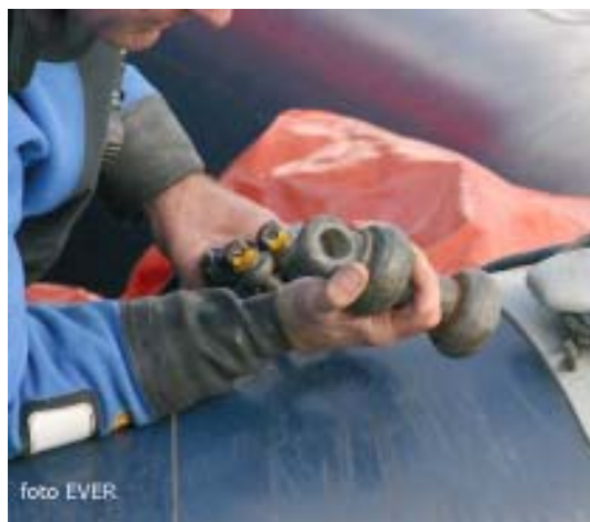
Geen handschoenen nodig ?

Het meest frappante is dat de 5kVA stroomgroep wel voorzien is van een aardingspijket, maar bij de demonstraties bleef die gewoon op de kade liggen -zie foto-. Dat wil dus zeggen dat de eventuele differentieelschakelaars, die de Fransen in de elektrische schakelkast hebben voorzien, niet kunnen