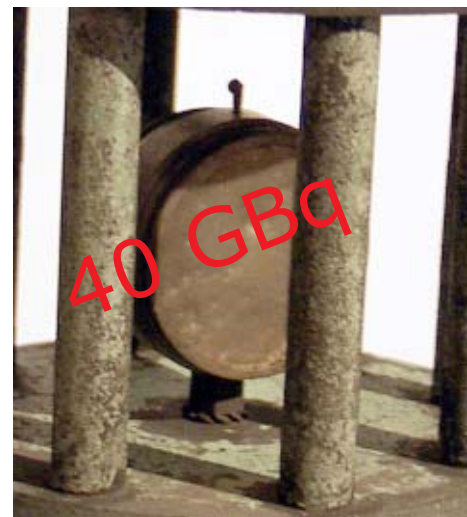
De Beryllium container van 5cm 3 heeft een bronactiviteit van 40GBq, bij duizenden is de Krypton 85 ontsnapt wegens ondermeer het gebrekkige mechanisch systeem -ventiel-.

Nemen we als voorbeeld de RADAC toestellen die begin jaren zeventig bij het IRE met duizenden werden gemaakt. De Beryllium containers van de RADAC bevatten ongeveer vijf kubieke centimeter Krypton 85, een