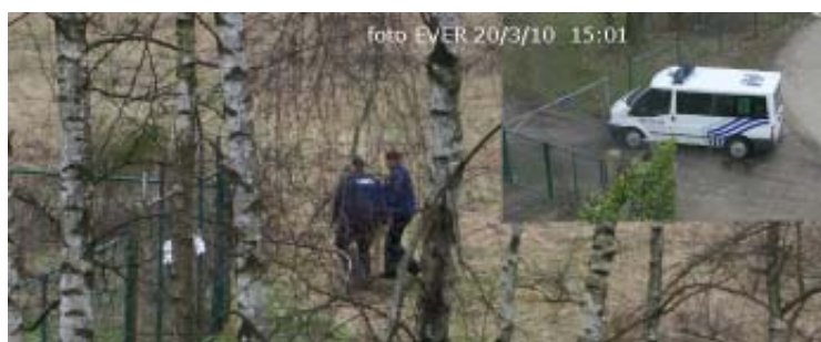
Foto rechts : De Genkse politie wordt om 18:07u opgeroepen, om 18:18u verlaten de boefjes het terrein langs de achterkant en om 18:19u daagt de politie op, die is niet blij dat wij vanuit het raam -vanaf een privé terrein- een foto nemen!

Ook de 2e interventie , die weinig diskreet verliep, leverde niets op, ergo, de mannelijke agent gooide een knuppel die de boefjes gebruiken binnen de omheining van het scouts lokaal, die knuppels gebruikt de bende om te "meppen" en ruiten in de slaan, de politie zou beter moeten weten en zo'n "wapen" meenemen in plaats van over de omheining te gooien-sic-