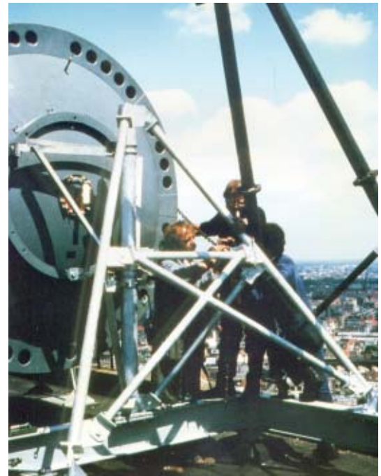
Nog één van de realisaties van de journalist van Morsum Magnificat, Anixter parabool van 2,40m diameter met Radome op het Thijsmansgebouw te Antwerpen in 1985.