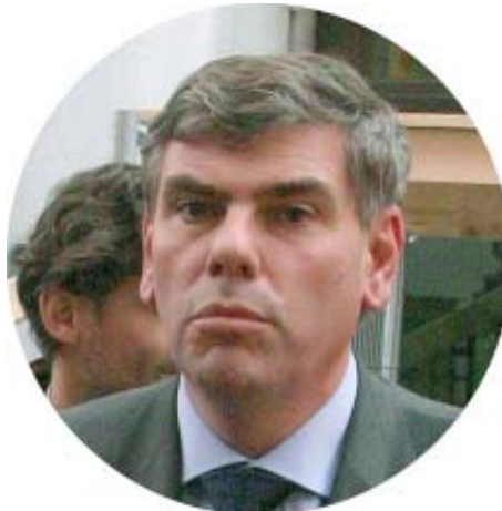
Filip Dewinter zoals hij in werkelijkheid is en zoals u hem moet zien

Op pagina 1 van Morsum Magnificat 160 brachten we het artikel van de persconferentie op de bouwwerf aan het Vlaams Parlement, Filip Dewinter hield op 13 november 2008 een persconferentie op een bouwwerf die in feite niet toegankelijk had mogen zijn. Opmerkingen aan zijn adres wuifde Dewinter weg men een kwinkslag. Het is vanzelfsprekend, dat Morsum Magnificat, die zich niet aflatend met veiligheid inlaat, zo'n flagrante overtreding op de toepassing van de veiligheid van het Vlaams Belang niet zondermeer kan laten voorbij gaan. Deze