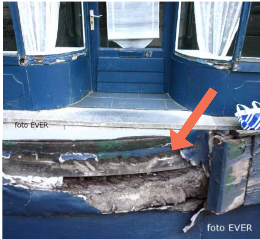
Dit is de raam aan de ingang van het gehuurde op n°147

opknapt. Ook de elektrische installatie wordt vernieuwd, maar een wettelijk vereiste keuring wordt niet meteen uitgevoerd, ook de conformiteit van de stookolietank werd niet nagegaan. Iedereen zou zich de vraag moeten stellen, hoe het komt dat, nadat Valère drie jaar in die studio woonde, er nu ineens een nieuwe vloer, mazoutkachel, douche, wc, nieuwe elektriciteit dient te worden geplaatst, moeten we van de veronderstelling uitgaan, dat het voordien