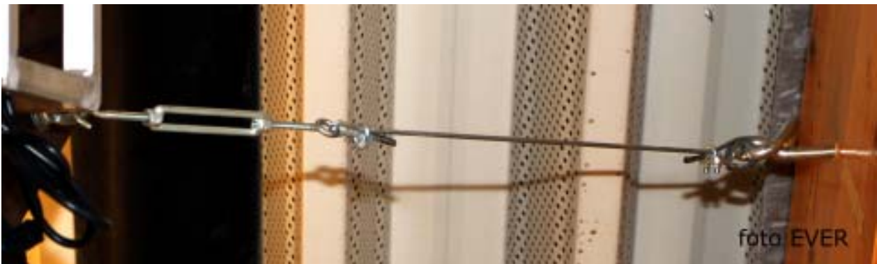
Deze lachwekkende spaninrichting is één van de elementen om een opgespannen zeil met halogeenverlichting overeind te houden, WASO Limburg heeft het al bekeken, maar heeft blijkbaar niets ondernomen.

Voor de opening van de Cosmodrome van 9 maart werd Morsum Magnificat, in tegenstelling tot de klassieke pers, niet uitgenodigd. Ondertussen weten we dat de Genkse samenleving, gestuurd door de CD&V, zich systematisch schuldig maakt aan uitsluiting. Voor de feestelijke opening van 12 maart waren we wel uitgenodigd, maar omdat wij geen enkele reden tot feesten hebben, sluiten we quasi nooit aan voor de recepties, dat laten we over aan de gatlikjournalisten.