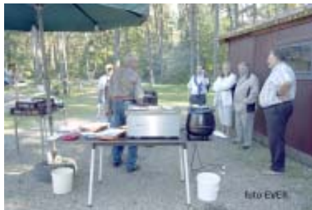
BBQ op 5 september in de Derby-club te Opglabbeek

De Vlaamse Diabetes Vereniging afdeling organiseert regelmatig activiteiten die in feite bedoeld zijn om de kassa te spijzen. Op 5 september 2010 was er voor 11 Euro p.p. te Opglabbeek een Barbecue, op 16 oktober voor 5 Euro een bezoek aan de Cosmodrome te Genk. Voor die 5 Euro was er een voorstelling in de fel overroepen Cosmodrome, een bezoek aan de koepel met de telescoop en tenslotte een koffie met -gesuikerd!- gebak in de cafetaria, alles samen zeker niet duur. Een bezoekje aan