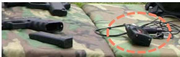
Onderaan rechts een UHF FM gemoduleerde zend-ontvanger die binnen een peloton zwaar bewapende soldaten wordt gebruikt.

Als gevolg van voorgaande vraagt de militaire leiding aan hun manschappen om bij de communicatie met de thuisbasis niet te praten over de operaties, niet over de voorbije, maar ook niet over de komende. Hier zit duidelijk een zeer zwakke schakel in de militaire structuur van de NATO door communicatie, die niet versleuteld -gecodeerd- is, vanuit een compound toe te laten. De militairen die deze redactie daarover tijdens de persconferentie te Bevekom