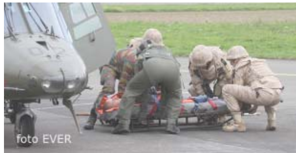
Evacuatie van een gewonde met de Agusta A109

Tijdens de persconferentie werden twee demonstraties georganiseerd; Transport van een gewonde per heli