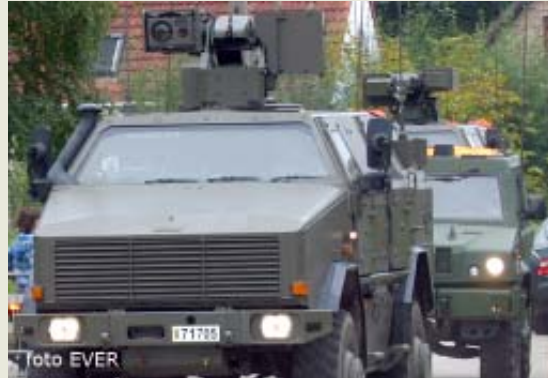
Vooran de MPPV, achteraan de LMV.

Het Belgisch-Luxemburgs detachement Force Protection bestaat uit een aantal onderdelen : - Commandocel. - Beschermingscompagnie - Logistiek steundetachment. - Detachement militaire politie. - Explosieve Ordnance Disposal-cel. - Medisch detachement - Detachement Communicatie en informatiesystemen.