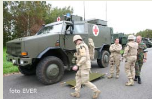
De eerste lijn medische zorgen voor de Belgische militairen bestaat uit een geneesheer, onderofficier- verpleegkundige en vrijwilligers paramedici en een ploeg hygiëne.

Belgische militairen. Dit detachement bestaat uit een geneesheer, een onder-officier-verpleegkundige en vrijwilligers paramedici en een ploeg hygiëne. Voor intensieve zorgen en spoedgevallen kan men terecht bij een Frans veldhospitaal waarin o.a. chirurgen, anesthesisten, kinesisten, tandartsen enz. worden tewerk gesteld die beschikken over state-of-the-art apparatuur. Bij ernstige kwetsuren of ziekten die niet ter plaatse behandeld kunnen worden,