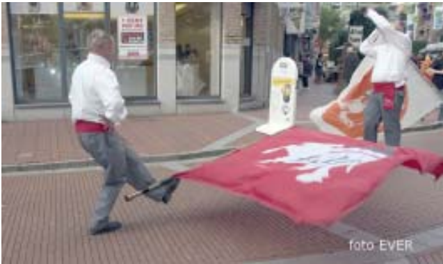
Ook dit vendelzwaaien was werk van de Aymons-Gezellen

heeft Morsum Magnificat zelf een beoordeling gemaakt en de Aymons-Gezellen een eremerkt toegekend.