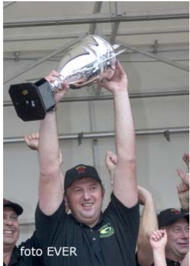
De BBCats uit Overpelt sleepten ook de Belgische BBQ kampioenbeker 2010 in de wacht.

S&S Apple werd in een hoekje naast het podium op het Stadsplein gestopt, een plaats waar niet veel passanten kwamen. Genk en Hasselt gaan niet samen door dezelfde deur, Genk is een "Dorp" zegt men in Hasselt.