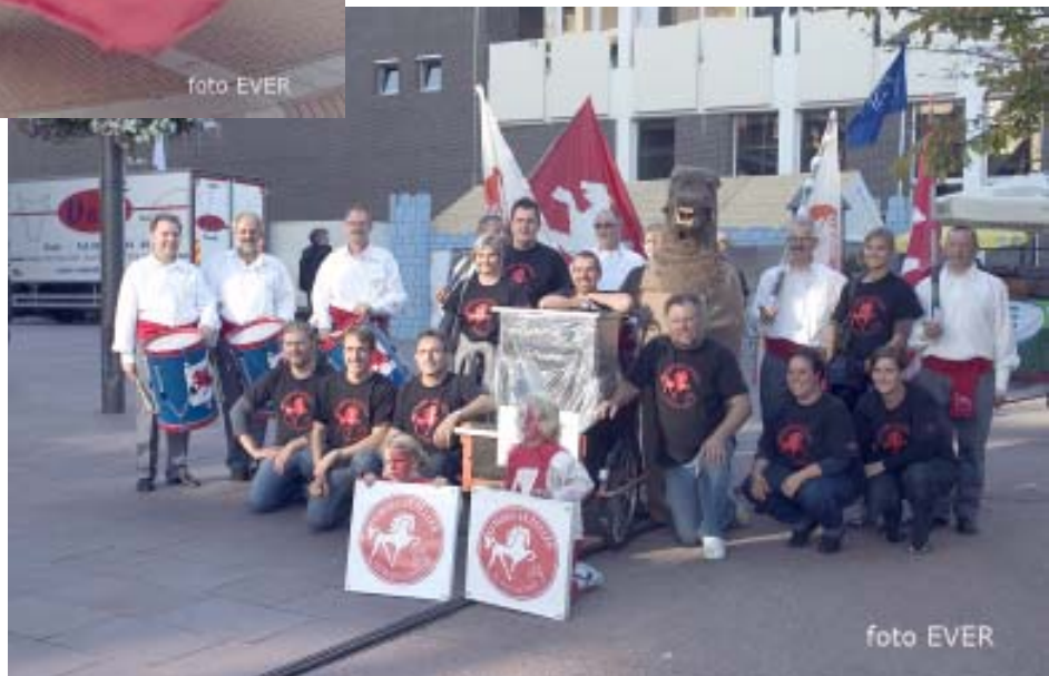
De Aymons-Gezellen uit Dendermonde, volgens Morsum Magnificat de beste groepsprestatie tijdens de optocht.

◀ Deze prestatie was zeker een vermelding waard