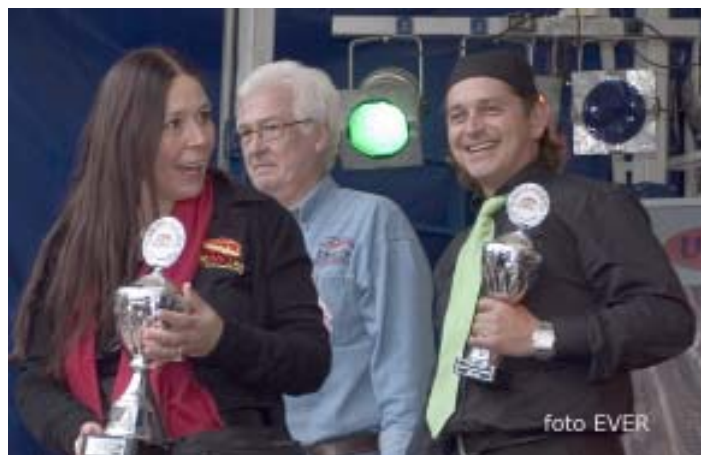
Bekers bij de vleet

In Het Belang van Limburg verscheen een artikel, waarin te lezen stond dat de BBQ óók al op zaterdag van start ging, de facto het publiek ook reeds haar