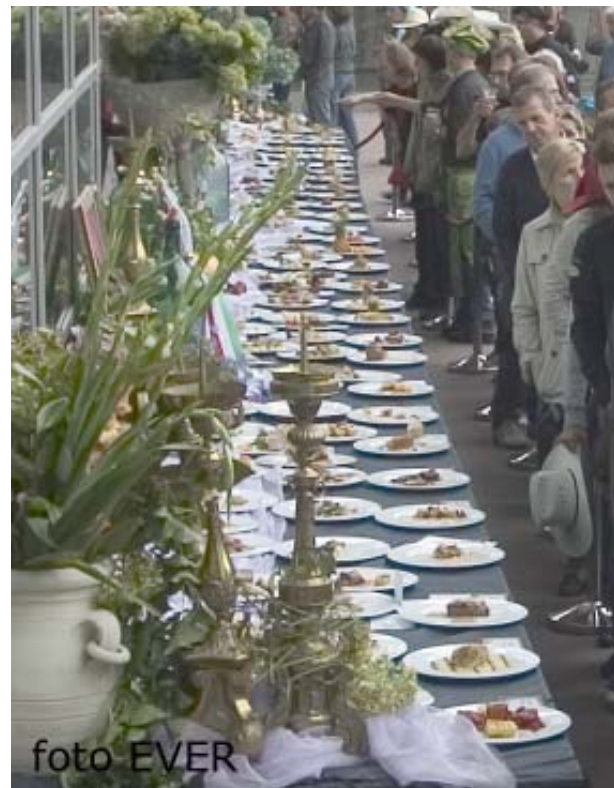
Bij Sint Vincentius voedselbedeling te Genk -en elders- moeten mensen aanschuiven voor wat eten, hier wordt het tentoongesteld om later in de vuilbak terecht te komen.