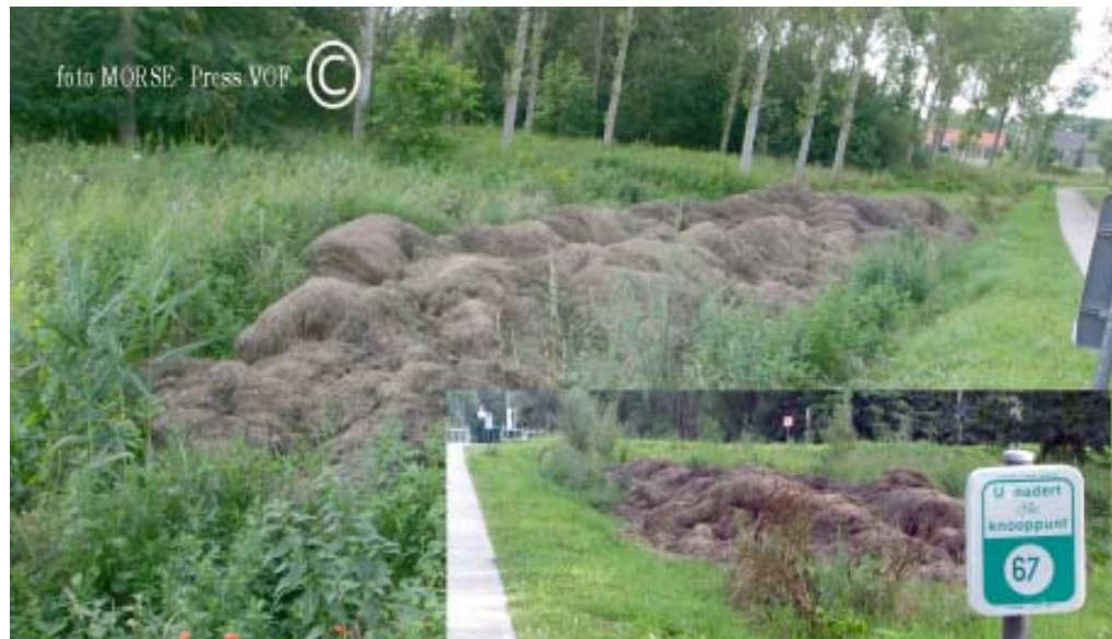
Tientallen kubieke meters rottend gras liggen langs het fiets/tractor/wandelpad te stinken

Tegen de brug hangt er een bordje dat die tussen 2 en 20 juli gesloten is, maar op vrijdag 13 juli is ze toch open ? Deze oude brug, die momenteel wordt geschilderd, wordt de Soldatenbrug genoemd omdat deze tijdens de oorlog door soldaten werd geplaatst.