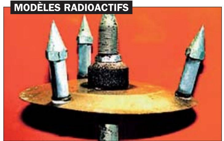
Horemans-Souply, Preventor, Kapton, Ionix, Radac, Helita ou de marque inconnue : voici les différents modèles de paratonnerres radioactifs recensés par l'Agence fédérale de contrôle nucléaire.