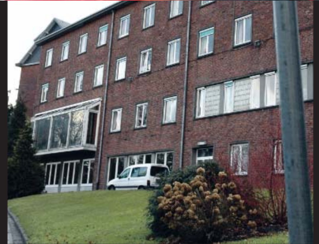
Jusqu'il y a peu, la maison de repos de la Kan, à Aubel, était encore surmontée par un paratonnerre radioactif. Labeye

On en parle peu mais des milliers de paratonnerres radioactifs sont toujours installés dans notre pays. Partout, parfois près de chez soi.