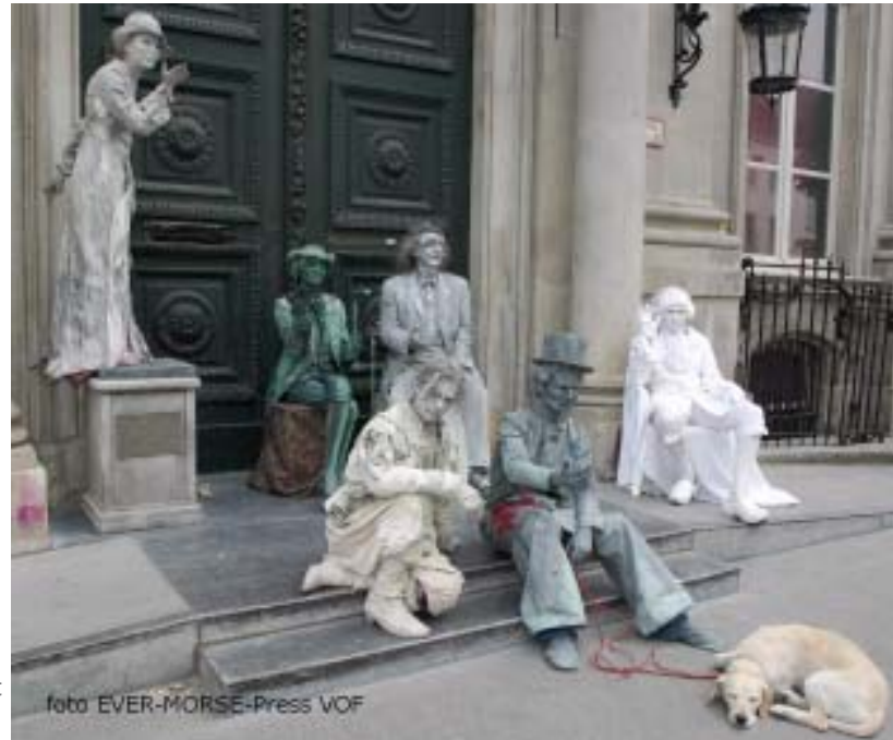
Alles was écht en prachtig, ook de hond

De 6 living statues op de Meir waren de moeite van het bekijken meer dan waard maar de "Ludozine" moet gezien worden als het zoveelste verkiezingsdrukwerk maar in een iets beter gestoffeerd jasje.