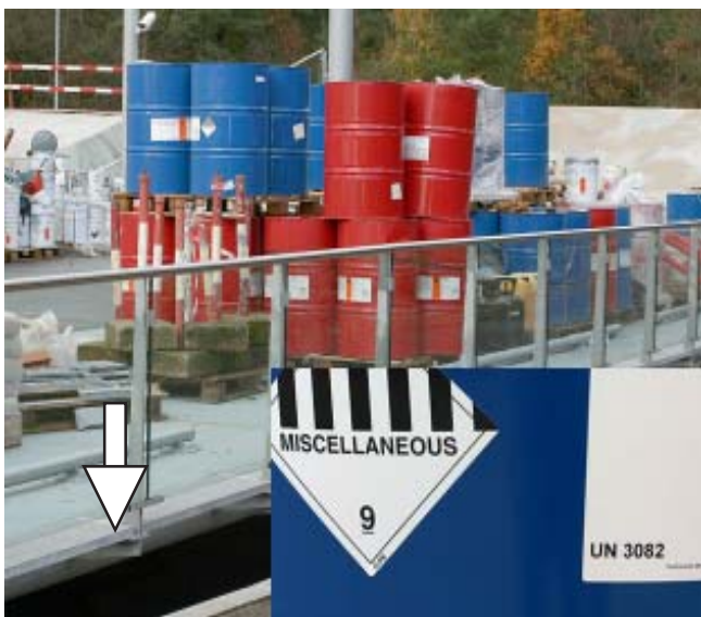
Wanordelijke en talrijke gevaarlijke situaties, vaten met milieugevaarlijke vloeistof en naast de oprit van het kinderdagverblijf een niet afgesloten valkuil (pijl)

Andere kinderdagverblijven in Genk weten wel dat daar één en ander "geregeld" wordt, maar omdat er in de sector genoeg werk is voor iedereen, wordt er omzeggens geen aanstoot genomen aan de voordelen die Wombat in natura geniet, "wij moeten ons bedruipen met het geld van de ouders van de kinderen die we bijhouden" zegt ons iemand uit de sector die anoniem wenst te blijven.